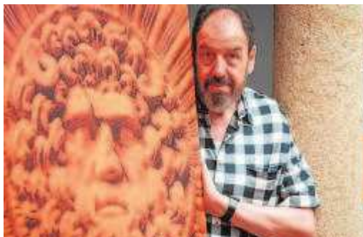
JOSÉ MARÍA POU

« Quien quiera ser millonario, que no elija esta profesión »