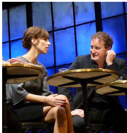
MARIBEL VERDÚ / FERNANDO CAYO

En síntesis los cinco son hijos de la denominada "era Kennedy" y los cinco reviven a golpe e recuerdo y trago largo, lo que ha sido y no ha sido de sus vidas y del tiempo que les tocó vivir.